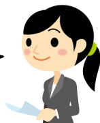
産業保健総合支援センター

病気になっても、働き続けることを多くの方が希望しています。私たちが両立支援をお手伝いします。